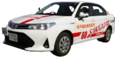
AT車 トヨタ アクシオ HYBRID