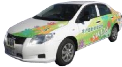
MT車 トヨタ アクシオ

※ 当教習所の企業講習では普通車のみのお取り扱いとなります。大型・中型車両をお使いの事業者様の場合、技術的な講習はできませんが、路上における「安全運転方法」は普通車でも十分指導可能です。